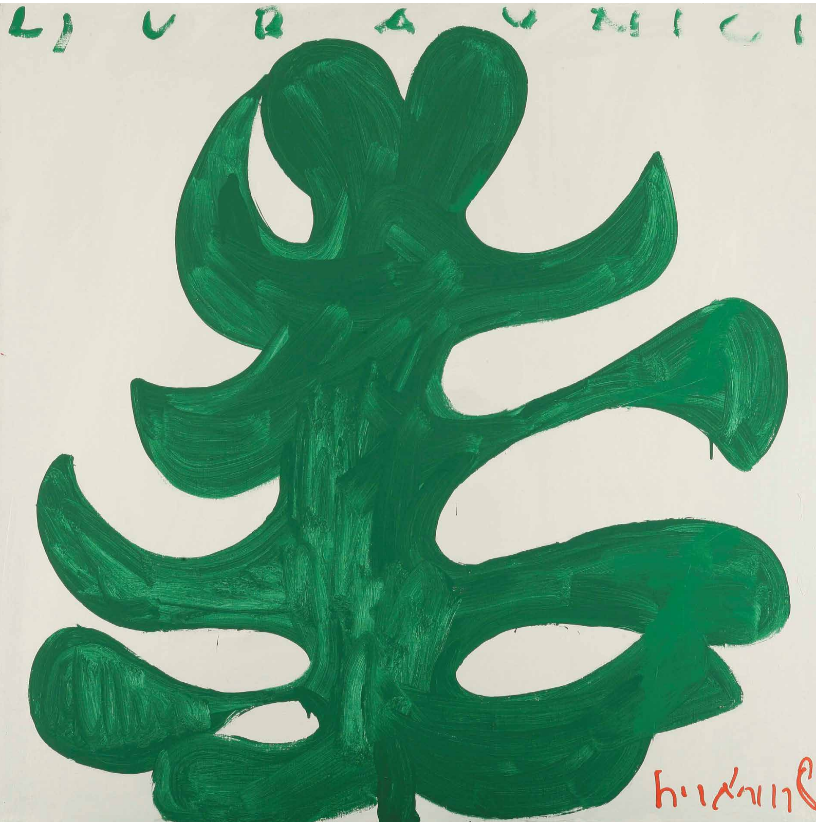
Boris Bučan Otoci filosi, ljubavnici , 2008 Acryl auf Leinwand / Acrylic on canvas