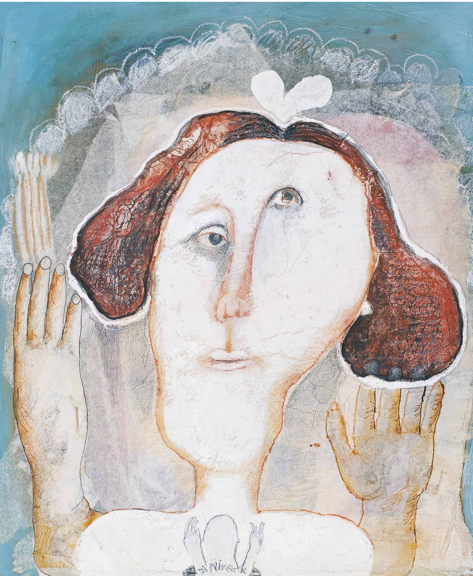
Nives Kavurić-Kurtović Tragom bezimernih istina, vječna bolničarka , 1982 Öl auf Holzplatte / Oil on wooden board, 25 x 24 cm