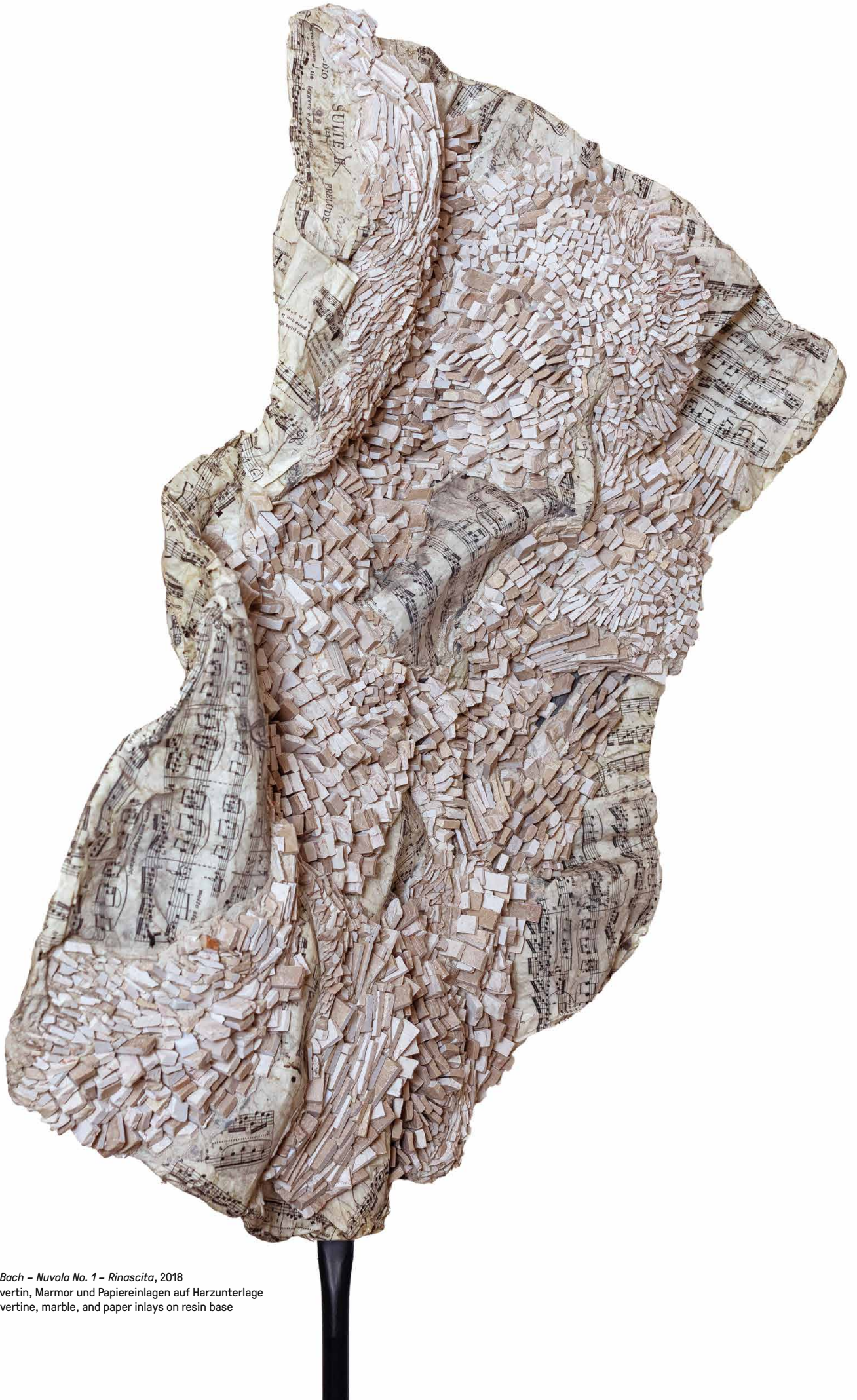
Omaggio a Bach - Nuvola No. 1 - Rinascita, 2018 Mosaik, Travertin, Marmor und Papiereinlagen auf Harzunterlage Mosaic, travertine, marble, and paper inlays on resin base 64 x 60 cm