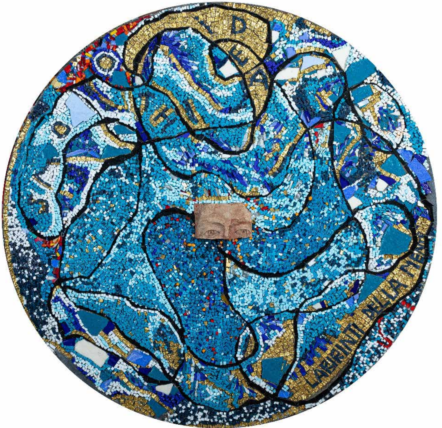
Labirinti della Mente , 2018 Polychromes Mosaik, venezianische Emaille, Orsoni-Gold, Orsoni-Silber, Marmor und Terrakotta auf Holzplatte Polychrome mosaic, Venetian enamel, Orsoni gold, Orsoni silver, marble, and terracotta on wooden panel Ø 100 cm