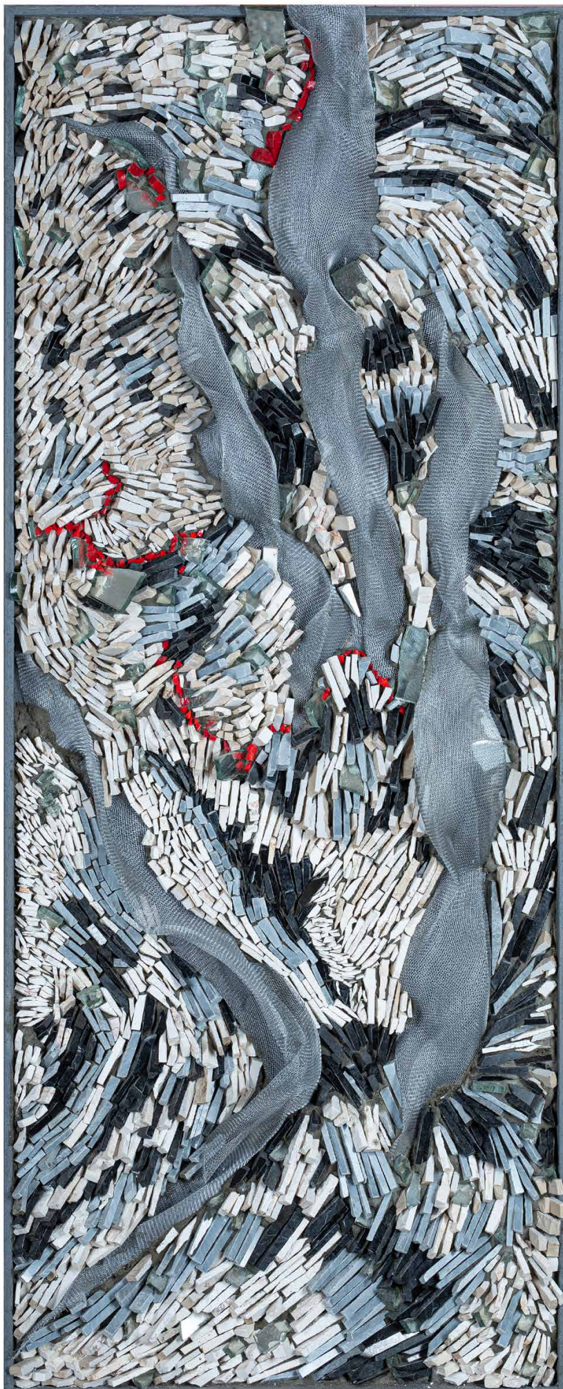
Omaggio a Hindemith – Ludus Tonalis: I colori della musica , 2018 Polychromes Mosaik, Travertin, Marmor und venezianische Emaillie mit Drahtgeflechteinlagen auf Holzplatte Polychrome mosaic, travertine, marble, and Venetian enamel with wire mesh inlays on wooden panel 100 x 42 cm