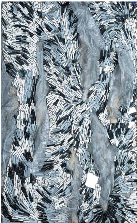
Omaggio a Hindemith – Ludus Tonalis: I colori della musica , 2018 Polychromes Mosaik, Travertin, Marmor und venezianische Emaille mit Drahtgeflechteinlagen auf Holzplatte Polychrome mosaic, travertine, marble, and Venetian enamel with wire mesh inlays on wooden panel 100 x 60 cm