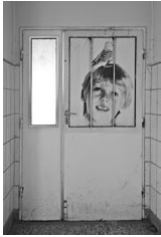
Krieg gegen Kinder Gewalt in Wiener Erziehungsheimen Verlängert bis 23.2.2014 Erdgeschoß