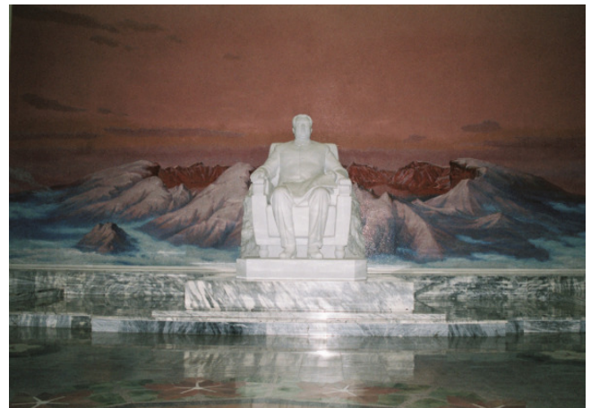
The Grand People's Study House, Pyongyang, North Korea, 2006