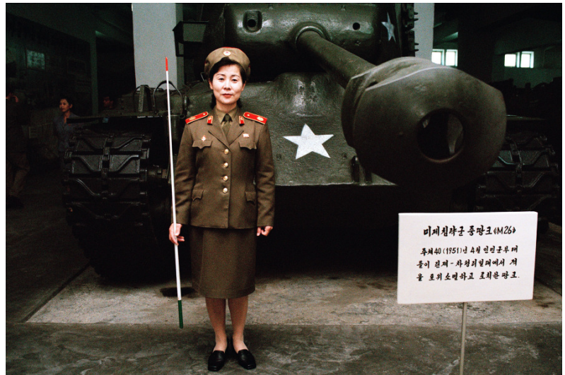
Victorious Fatherland Liberation War Museum, Pyongyang, North Korea, 2006