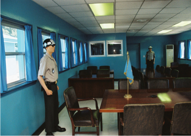
Korean Demilitarized Zone (DMZ), Joint Security Area, conference room, Panmunjom, South Korea, 2013