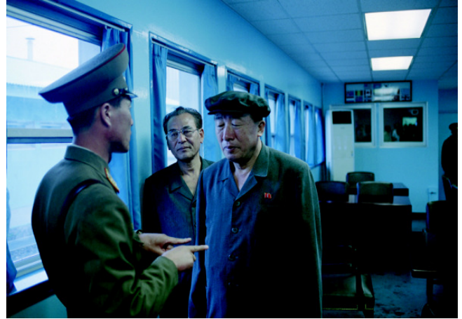
Korean Demilitarized Zone (DMZ), Joint Security Area, conference room, Panmunjom, North Korea, 2006