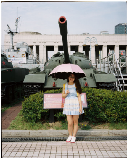
War Memorial of Korea, Seoul, South Korea, 2013

Die Fotos sind ausschließlich frei zur redaktionellen Verwendung im Rahmen der Berichterstattung zur Ausstellung „Luca Faccio - Common Ground - Foto und Videoarbeiten zu Korea“.