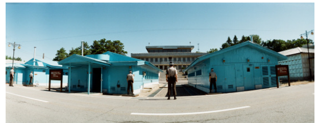
Korean Demilitarized Zone (DMZ), Joint Security Area, conference room, Borderline, Panmunjom, South Korea, 2013

Foto-Download unter: www.k-haus.at/de/presse/aktuell