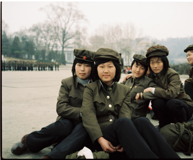
Pyongyang, North Korea, 2013