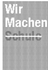
Wir machen Schule Kunst in Bildungsprozessen 22.01. – 31.1.2014 täglich 16–19 Uhr Passagegalerie