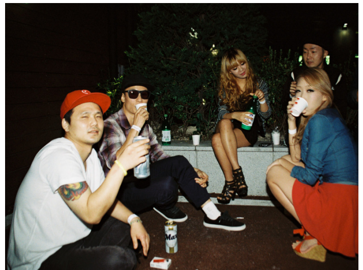
Seoul, South Korea, 2013