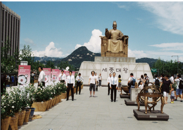
Monument Sejong the Great of Joseon, Seoul, South Korea, 2013