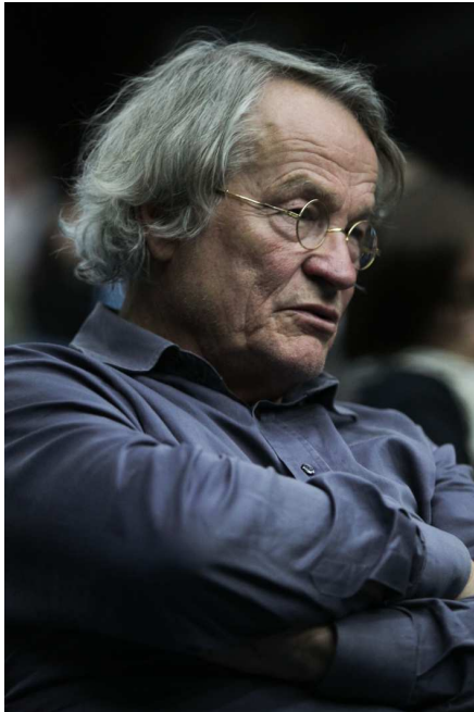
Peter Stein, 2010

Download unter: www.k-haus.at/de/presse/aktuell