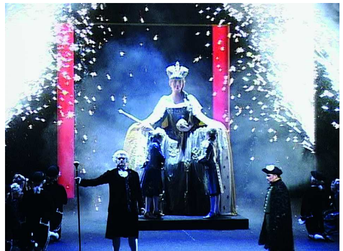
P. I. Tschaikowsky, Pique Dame (Ensemble)